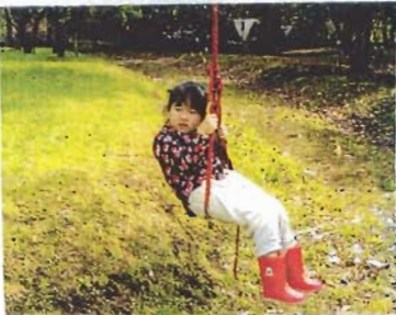
アヒダスの少女ハイジ?